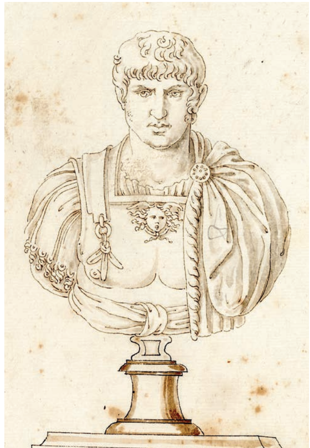
Fig. 5. Jacopo Strada, busto di Nerone, dettaglio della fig. 3.

to simile alla testa proveniente dal Palatino: alcuni tratti di penna, al di sotto delle lunghe basette, sembrerebbero proprio alludere, nel disegno di Jacopo Strada, alla presenza di una corta barba (fig. 5).