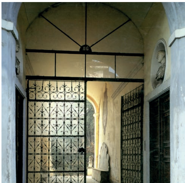
Fig. 6. Androne del palazzo di Giulio Ometto a Bra (con i busti virili al di sopra delle porte) (da Asta Sotheby's 2002, frontespizio).

sione, sarebbero arrivati a Torino i due busti virili già esposti nell'androne del palazzo di Bra (fig. 6) e passati in asta insieme a quello di Nerone, di cui entrambi condividono le vicende collezionistiche 13 . Anche in questo caso, l'analisi stilistica di chi scrive e le ipotesi di datazione si basano esclusivamente sulle fotografie edite nel catalogo di vendita.