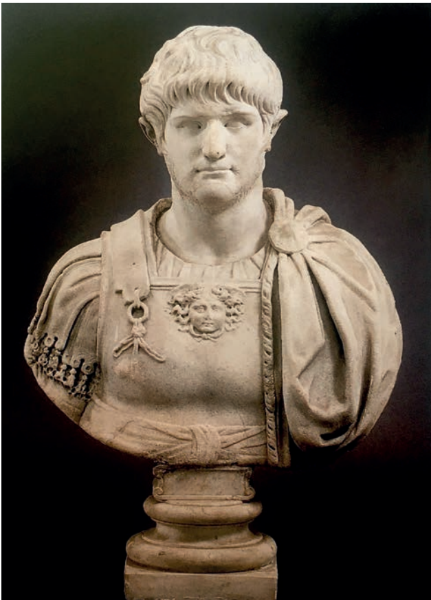
Fig. 4. Busto di Nerone, marmo, testa all'antica o del 59-64 d.C. con rilavorazioni moderne su busto rinascimentale (già nella collezione di Giulio Ometto a Bra) (da Asta Sotheby's 2002, p. 46).