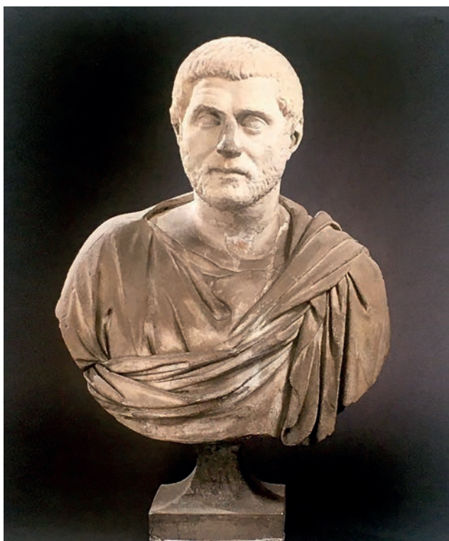
Fig. 7. Busto di uomo maturo, marmo, testa all'antica o del III secolo d.C. su busto rinascimentale (già nella collezione di Giulio Ometto a Bra) (da Asta Sotheby's 2002, p. 45).