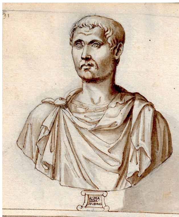
Fig. 10. Jacopo Strada, ritratto del cd. Severo Alessandro, Vienna, Österreichische Nationalbibliothek (da Codex Miniatus 21,3, f. 66 verso, n. 31).