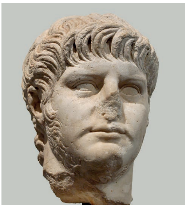
Fig. 2. Testa di Nerone dal Palatino, marmo, 59-64 d.C., Roma, Museo Palatino.