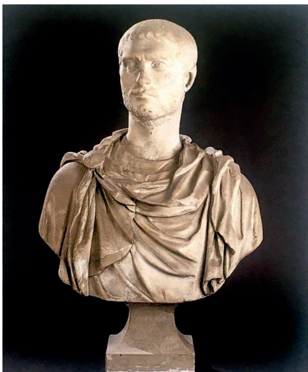
Fig. 8. Busto di giovane uomo, marmo, testa all'antica o del III secolo d.C. su busto forse antico (II-III secolo d.C.), con integrazioni moderne (già nella collezione di Giulio Ometto a Bra) (da Asta Sotheby's 2002, p. 45).