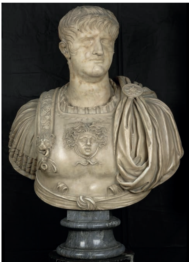
Fig. 1. Busto di Nerone, marmo, testa del 59-64 d.C. su busto moderno, Firenze, Gallerie degli Uffizi.