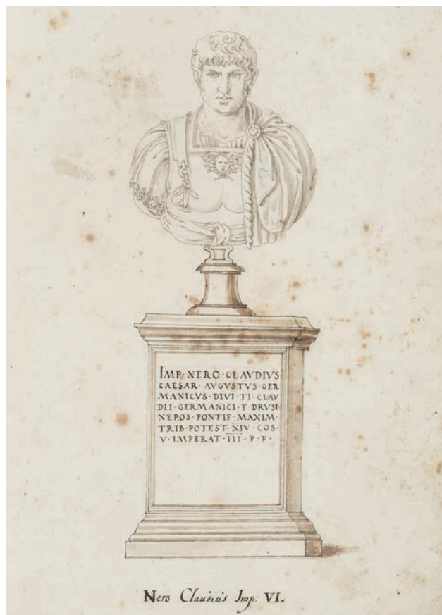
Fig. 3. Jacopo Strada, Busto di Nerone, disegno a china con acquerellature, Dresda, Kupferstich-Kabinett Residenzschloss (da Imperatorum Romanorum ac eorum coniugum liberorum , Ca. 74/6).

bordato da una vistosa frangia finale, che scende in verticale al di sotto della fibula; nello spallaccio destro non c'è traccia della protome leonina e neppure del ricco fregio d'armi che caratterizza il busto degli Uffizi; i lembi della cintura non si rimboccano ai lati del nodo e, infine, la testa è quasi perfettamente frontale, mentre nel busto fiorentino è ruotata un po' a sinistra e con lo sguardo rivolto verso l'alto.